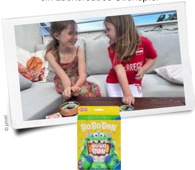
„Bo Bo Bon“

Alter: ab 5 Jahren, Anzahl: 2–4 Spieler/innen, Spieldauer: ca. 15 Minuten, Preis: 10,99 Euro, Ravensburger